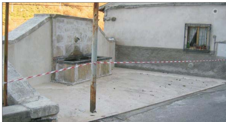
La fontana dopo il restauro