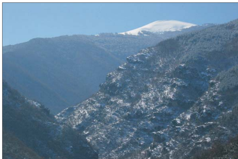
Veduta del Monte Genzana