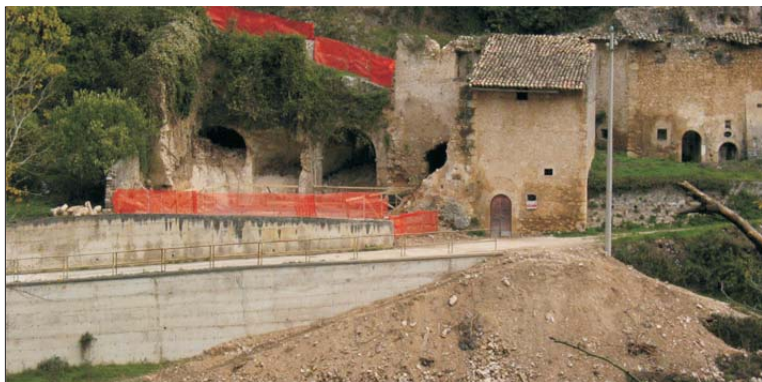
Pagliare in "restauro"

Anno 2005 - € 65.000, Realizzazione corsi di formazione.