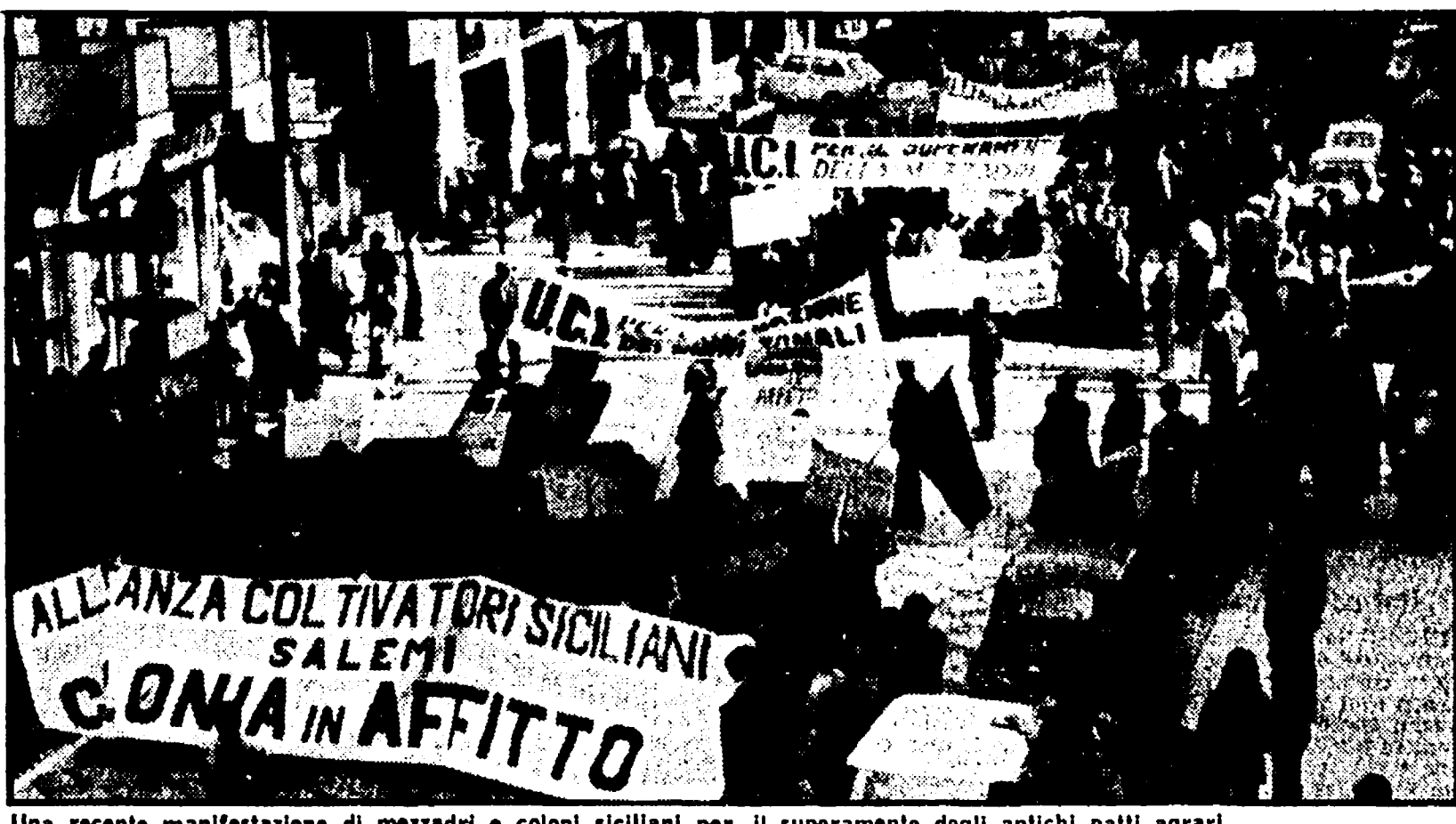
Una recente manifestazione di mezzadri e coloni siciliani per il superamento degli antichi patti agrari